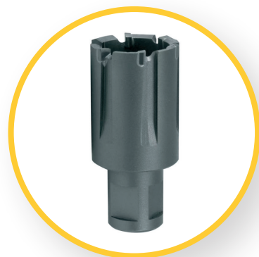
RAILCUTTER KERNBOHRER HM