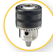
ZAHNKRANZBOHRFUTTER 13 MM 1/2" X 20 UNF (IBK.13)