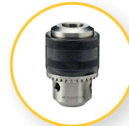
ZAHNKRANZBOHRFUTTER 13 MM (IBK.13-B16)