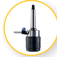
SCHNELLSPANNAUFNAHME MK2 (IMC.2Q)