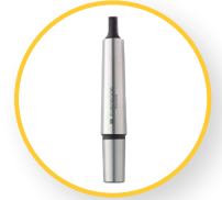
MORSEKEGEL MK2 - B16(B16-MC2)