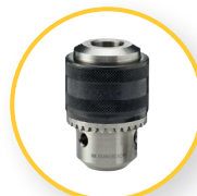
ZAHNKRANZBOHRFUTTER 13 MM (IBK.13-B16)