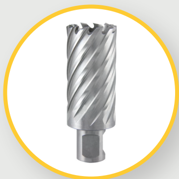
HSS C05 AUSFÜHRUNG