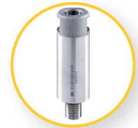
ADAPTER 1/2" X 20 UNF (IBK.15)