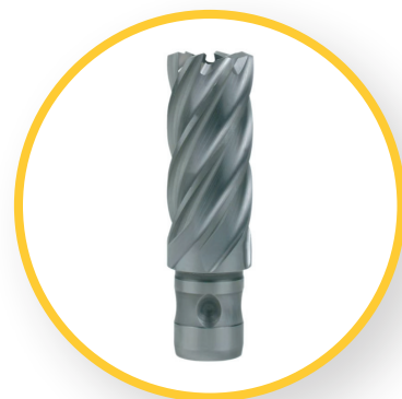
HSS CO 5 MIT QUICK IN AUFNAHME