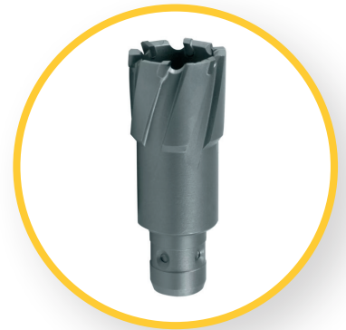
KERNBOHRER HM MIT QUICK IN AUFNAHME