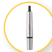
MORSEKEGEL MK3 - B16(B16-MC3)