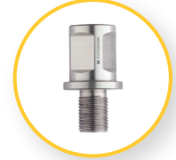
ADAPTER WELDON 1/2" X 20 UNF (IBK.14)