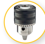
ZAHNKRANZBOHRFUTTER 13 MM 1/2" X 20 UNF (IBK.13)