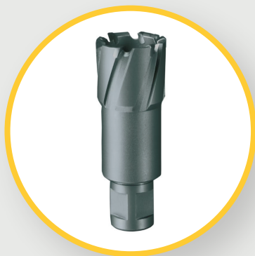
KERNBOHRER HM MIT WELDON AUFNAHME