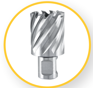
HSS C05 AUSFÜHRUNG