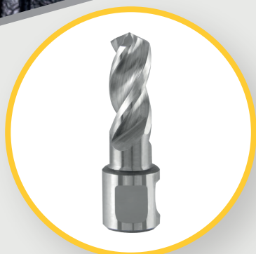
VOLLBOHRER 2S HSS MIT WELDON AUFNAHME